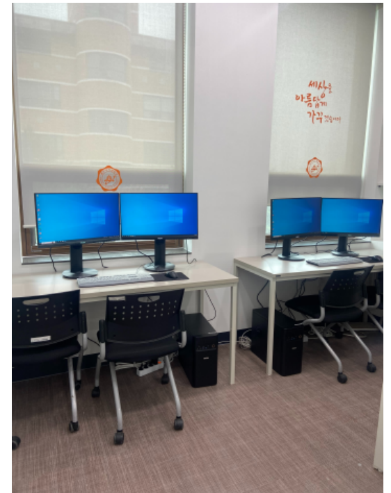
대기실 및 면접분석실