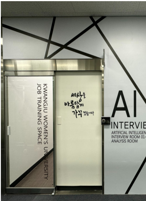
광주여자대학교 도서관 2층 그룹스터디룸 옆